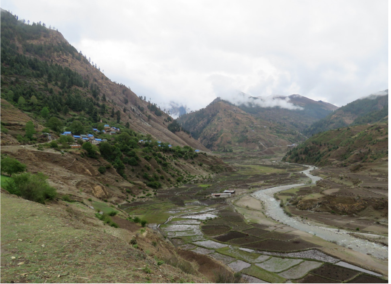
गुठीचौर गाउँपालिकामा डोल्चागाड एमएचपी नजिकै नदीको किनारमा रहेको कृषि भूमि ।