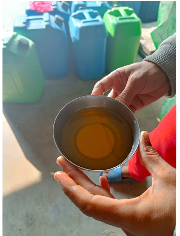
जुम्लामा गरिएको ढँटेलो तेलको उत्पादन ।

मूल्य अभिवृद्धि प्रक्रियामा एउटा महत्त्वपूर्ण चरण भनेको बीउको प्रशोधन हो । जुम्लाका सन्दर्भमा, सफा, उच्च गुणस्तरको तेल उत्पादन गर्न बीउ प्रशोधन गर्ने क्षमता भएका स्थानीय उद्यमहरू स्थापना गर्न सके आर्थिक लाभ र स्थानीय समुदायमा प्रवाह उल्लेखनीय रूपमा बढाउन सक्छ । उदाहरणका लागि, स्थानीय स्तरमा ढँटेलो तेलमात्र प्रशोधन गर्ने तेल मिल भएमा स्थानीय समुदायलाई उच्च-मूल्यको उत्पादन तयार गर्न सहयोग पुग्दछ । यो उद्यम बीउ सङ्कलन व्यवस्थित गर्न, कच्चा पदार्थका लागि मूल्यहरू तोक्न र शहरी बजारहरूसँग जोड्न सहकारी मोडेलमा आधारित हुन सक्छ । सहकारीहरूले लाभांशका रूपमा नाफा वितरण र समुदायको स्वामित्व बढाउने थप फाइदाहरू पनि प्रदान गर्दछ । यसका अतिरिक्त, मूल्य शृङ्खलामा सान्दर्भिक पक्षहरूसँग सम्पर्क र सम्बन्ध स्थापना गरेर र स्थानीय उद्यमहरूको बजार क्षमता बढाएर अवस्थित व्यावसायीकरण प्रणाली हरू भित्र स्थानीय उद्यमको प्रभाव बढाउनु महत्त्वपूर्ण छ,